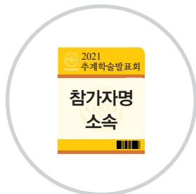
출입증 명찰 수령