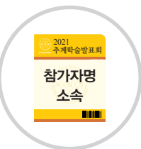
출입증 명찰 준비