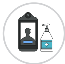
발열체크 및 손소독