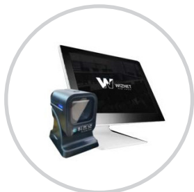
등록데스크에서 바코드 태그