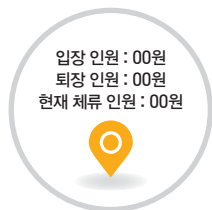
회의장 체류 인원에 따라 회의장 입장 또는 안내원의 안내에 따라 시청각실(3층 컨벤션 II홀)로 이동