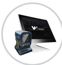
입퇴장시 명찰 바코드 태그