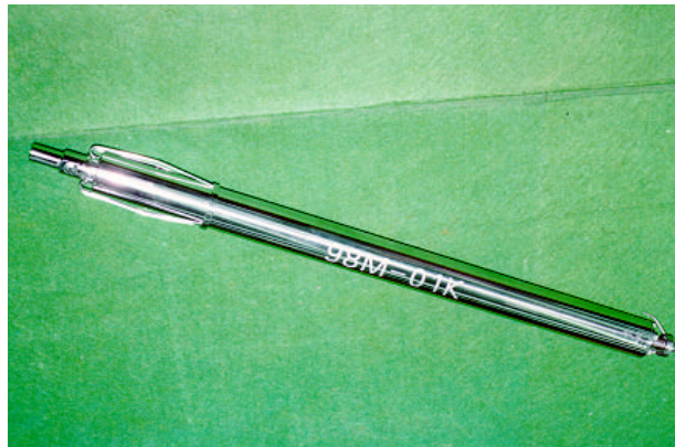
Fig. 4. Photograph of 98M-01K after assembling