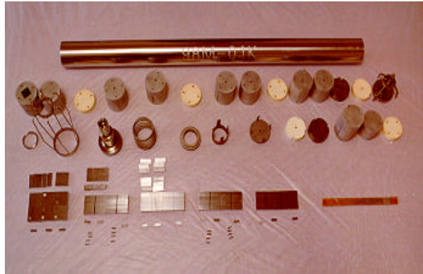
Fig. 3. Photograph on parts of 98M-01K before assembling