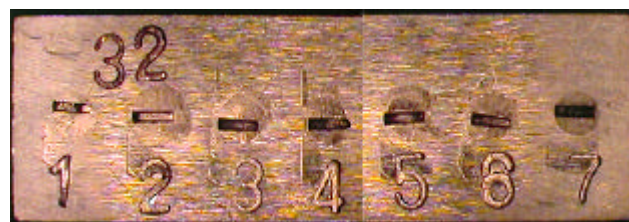
Fig. 2. Photograph of a thermal monitor